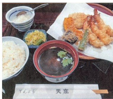
天ぷら定食 1,500円(税込)

創業明治42年、天ぷら一筋に地域の皆様に愛され、変わらぬ味を提供して参りました。 感染対策も徹底して営業しております。また、テイクアウトもできます(テイクアウト天丼1,500円)。 今後とも本郷・湯島御地域の皆様ぜひお立ち寄りください。