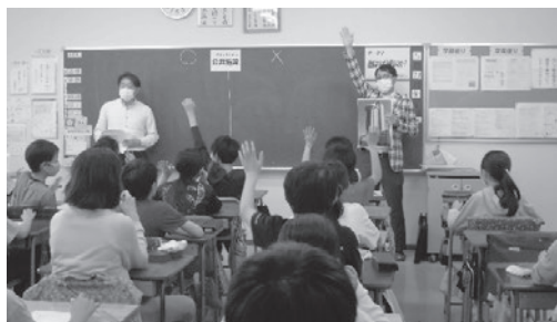
青年部会による「租税教室」の様子

TEL:03-3812-0595 FAX:03-3815-2401 e-mail:info@hongohojin.or.jp