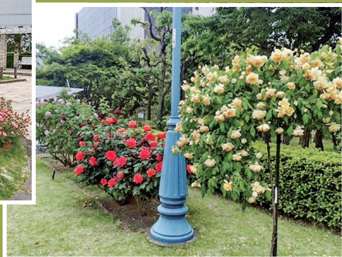
本郷給水所公苑