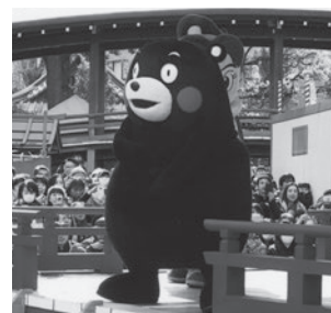
▲ くまモン体操を踊る