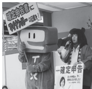
▲ 確定申告のPRをするイータ君と税務職員