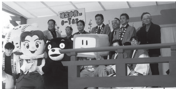
▲ 蝶名林署長(後列中央)と税務関係団体の役員さん

また、島原の戦いの時に天草と島原のキリシタンが定期的に話し合いをした別名「談合島」とも言われ、2013年から上天草市と文京区は「湯島」をキーワードに交流を始めた。