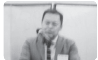
(株)アムモ98 映画・DVD・製作配給 本郷5丁目 小田泰之 氏