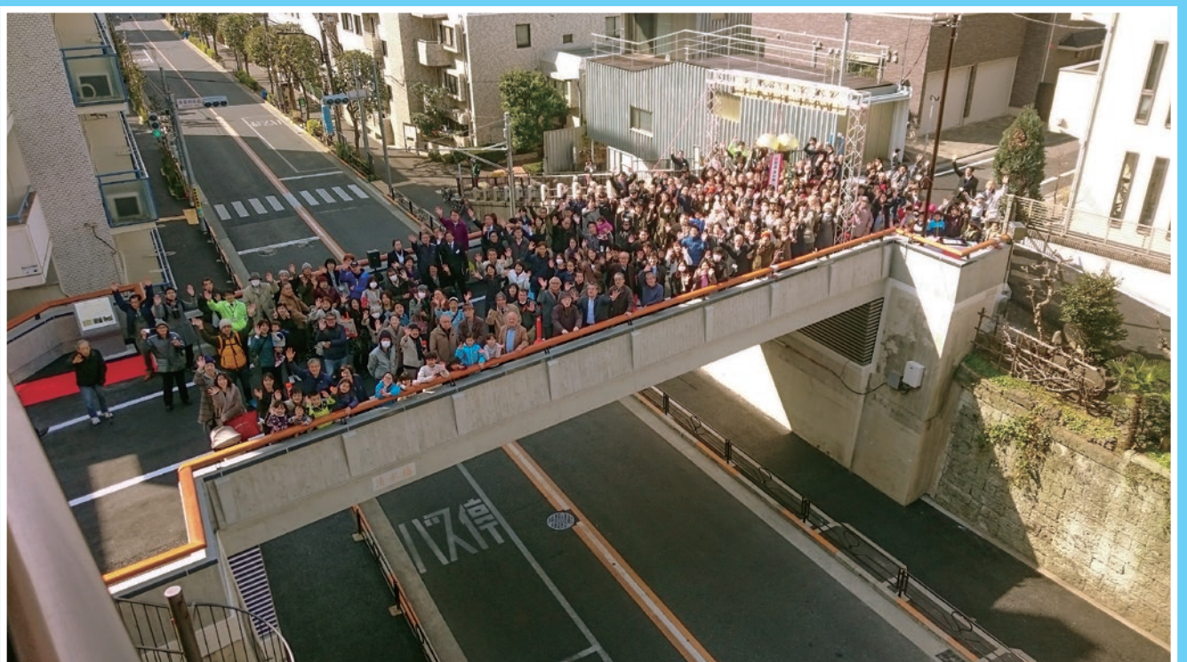
▲清水橋(からはし)渡り初めの様子 施工は本郷法人会会員(株)松下産業 説明文はP.6に掲載してあります。