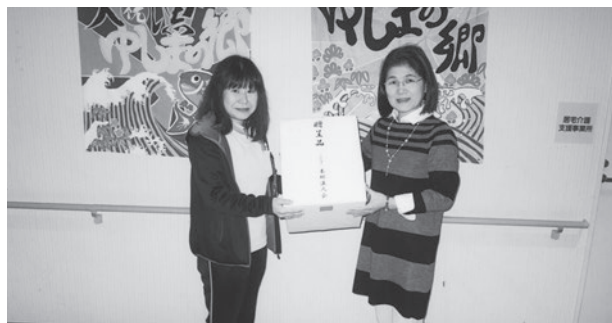
▲ 飯村部会長(右)とスタッフの方

また、使用済みプリペイドカードや使用済切手などを3月29日(金)に文京区社会福祉協議会にお届けした。