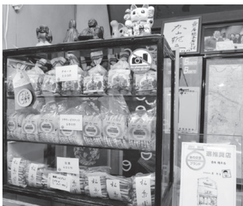
明治の製法そのままに現在も作っているビスケット

このようにさまざまな文学作品に描かれるほど、時代を超えて江戸および東京市民に親しま