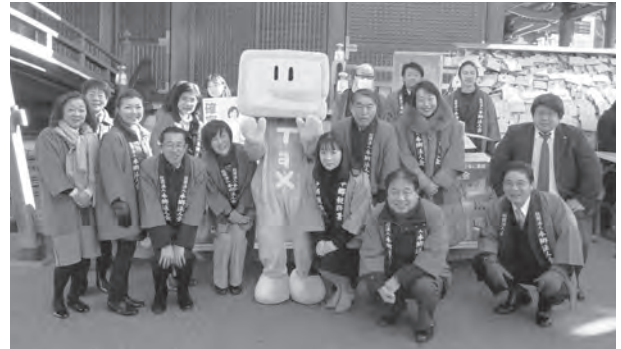
▲ 松林署長（イータ君の右）・幹部の方と記念撮影をする役員方

当日は「第60回梅まつり」の期間中で大勢の観梅客で賑わう中、松林署長以下幹部の方々も参加されマイナンバーや確定申告のチラシ、文京区観光ガイドマップなどを配布した。