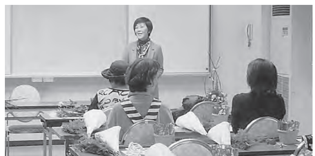
▲ あいさつをする山中女性部会会長