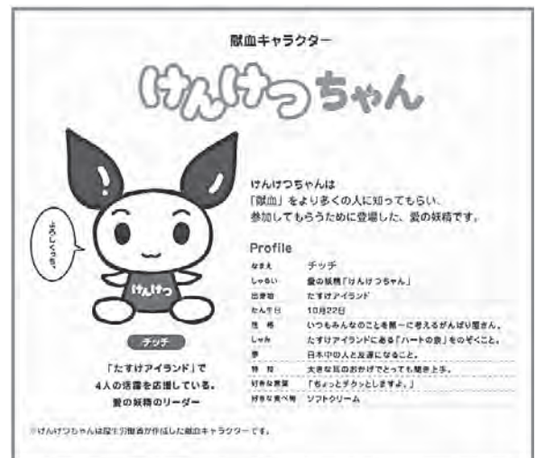
▲ 献血キャラクター