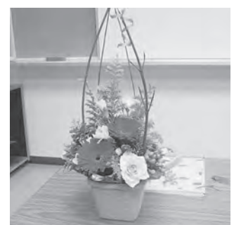
▲ 完成したフラワーアレンジメント