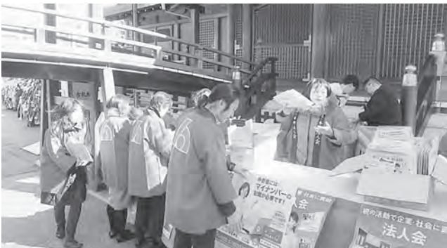
▲ 配布物の準備をする役員方