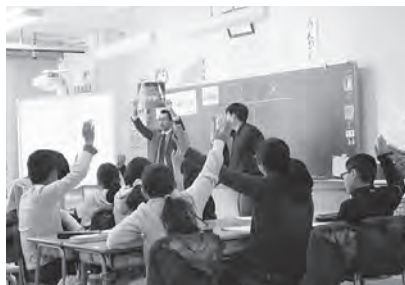
▲ 本郷小学校 塙部会長（左）小安副部会長