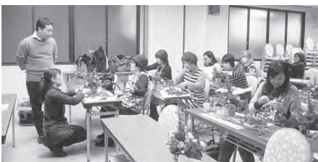
▲ 講師を務めて頂く(有)宮田花店の方々