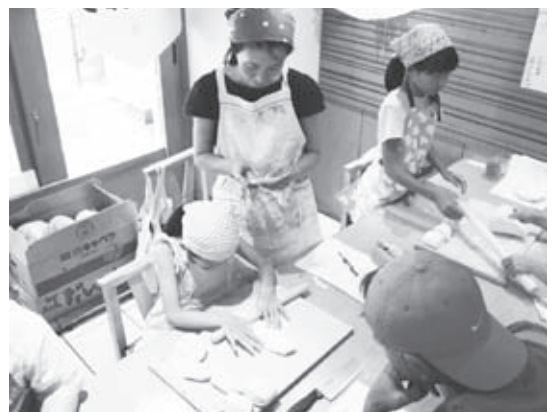
▲麺を打つ参加者の皆さん