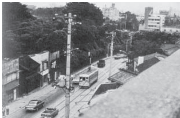
▲切通坂を天神下方面に向かう都電。プラザホテルの屋上から撮影か。左側は岩崎邸(現・ハイタウン)〈1968年(昭和43)〉

※ 法人会では様々な記事を募集しておりますので、掲載していただきたい記事があれば委員会で検討いたしますのでお寄せ下さい。