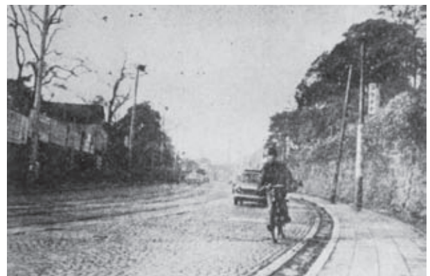
▲本郷方面から下る切通坂。左側に湯島天神、右側に岩崎邸の石垣(1962年(昭和37年ころ)) (写真集「文京」より)

東京オリンピックが開かれた1964年(昭和39)には都内の高速道路網もでき、1967年に