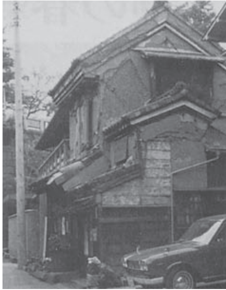
▲女坂のたもとにあった文政年間の土蔵づくり (1968年(昭和43年))

命を賭けても成し遂げたい、そして、すべて勤労奉仕によって約3年間で完成させるよう」と、すべてを打ち込んで進められ、見事な梅園が完成し、今や東京の名所、憩いの場として知られ、多くの人たちが見物に訪れるようになりました。