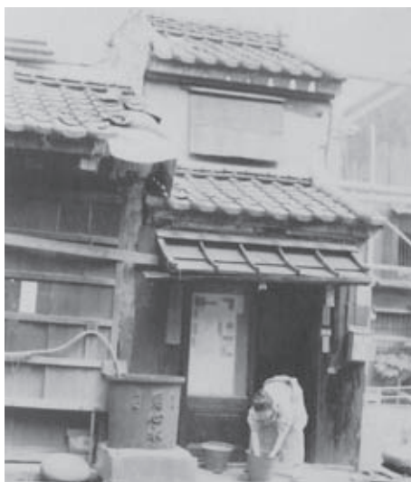
▲女坂の手前にあった土蔵づくりの民家 (1966年(昭和41))

者が中心になり、「社会のためになることをしたい」という願いから「天三若睦会」が組織され、その後「天神町若睦会」に改称して活動を広げ、地域一帯の夜警、青少年育成、お祭り行事などの活発な活動が行われました。