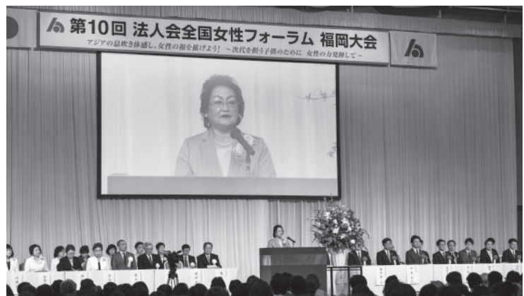
▲ あいさつをする政所女連協会会長