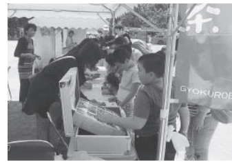
▲ 税金クイズに解答してもらう