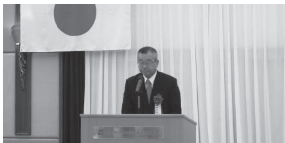
▲ 祝辞を述べる堀腰署長