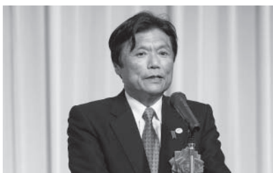
▲ 祝辞を述べる小川福岡県知事