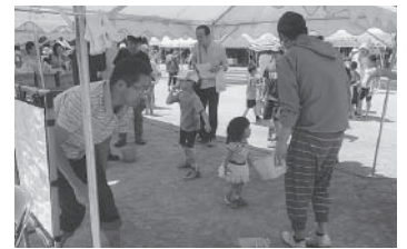
▲ ストラックアウトを楽しむ子供達 ▲