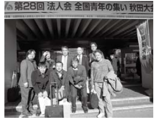
▲会場前での記念撮影

終了後はレンタカーで田沢湖に行き男鹿半島でなまはげ館に立ち寄り、生のなまはげに幾度なく脅され素晴らしい体験に感動しました。宿にチェックイン後は源泉かけ流しの温泉で一日の疲れを癒し、夕食は宿自慢の秋田郷土料理で水を張った桶に真っ赤に焼けた石を次々と放り込む磯焼き料理は圧巻でした。翌日も目一杯秋田を堪能し新幹線の待ち時間に蕎麦をいただいていると新幹線に乗り遅れそうになるというアクシデントも乗り越え無事東京に戻ってまいりました。