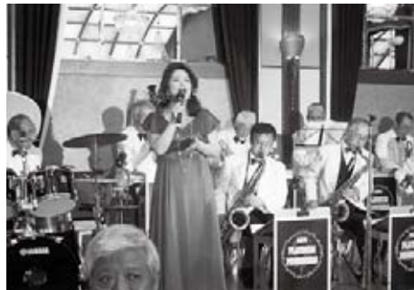
▲プラチナテンショナーズオーケストラの演奏が華を添えた