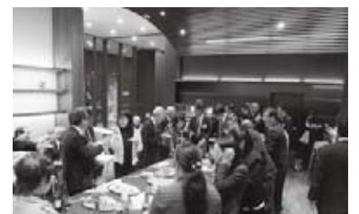
▲試飲をする参加者たち