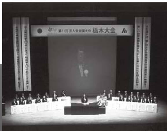
▲大会会場となった栃木県総合文化センター▲