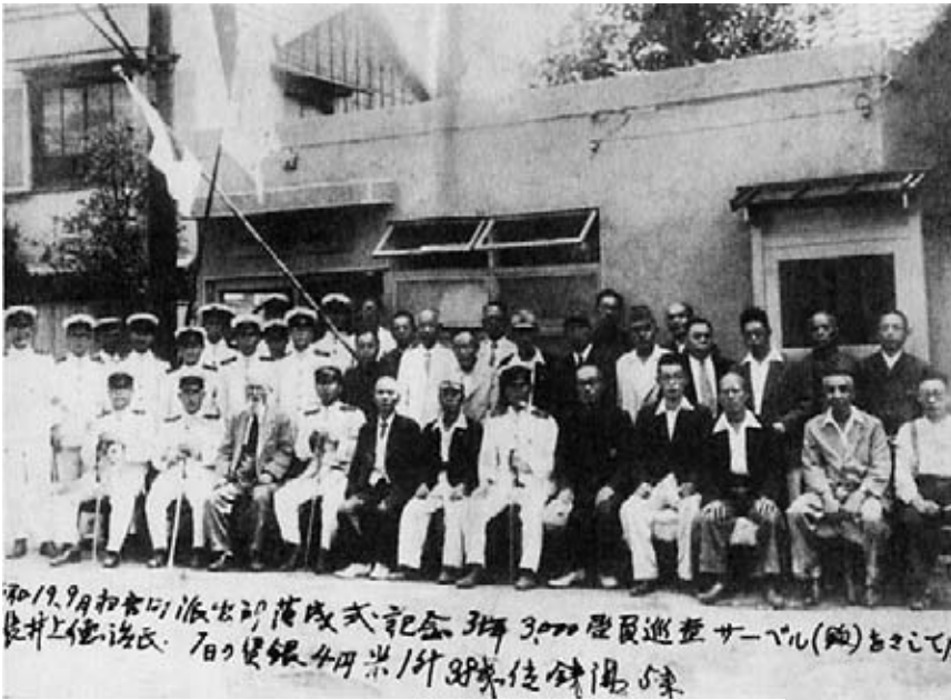
昭和19年9月初音町派出所落成式記念(4#家のアルバニア)