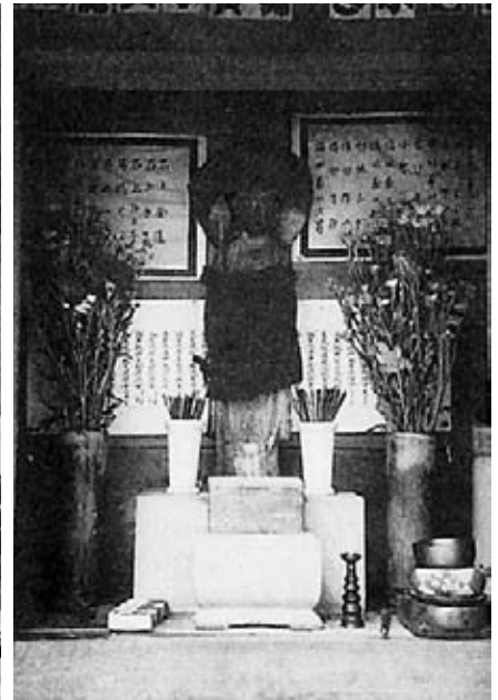
▲自発的に守り続けているお地蔵さま

戦になった。女子どもは疎開し、男は応召して町に人が少なかった。父は毎日警防団、姉と私でどうにかご飯を作ってた。同い年で志願して幼年学校に入った子もいました。霞ヶ浦の海軍幼年学校なんて七つボタンで憧れでしたけどね。行った人は十代で亡くなってますね。こっちは中学生で、尾久の駅前にあった飛行機に塗るペンキの会社に勤労働員で行ってました。そこが空襲で焼けたあとは、焼け野原の片づけです。ヘンな時代ですよ。男と女は手をつないじゃいけない。ネクタイ、タオル、サンダルなんて言っちゃいけない。三月四日は雪の降りそうな日でした。鉛色の空で九時ごろウーウーと空襲警報が鳴ったままやまない。谷中小学校の屋上に海軍が警備に来てて、海軍が来るようじゃ終わりだね、と言ってました。上野の山は高射砲の陣地でしたが、いくら撃っても当たらない。敵さんは千駄木のほうから須藤公園を越え、谷中・上野へ向けて飛んできた。かなり低空で来ましたから、爆弾が斜めに落ちて、土も柔らかいものだから穴だけあいて、爆裂せずに不発になるのもあった。私はよみせ通りにあった初音町交番のお巡りさんと一緒に交番の後ろの防空壕に入ったんです。