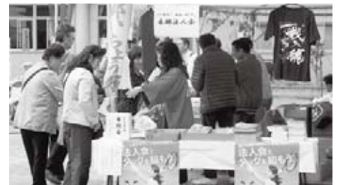
▲税に関するパンフレットなどを来場者に配布

本郷商店会主催による第12回本郷いちょう祭りが10月26日(日)、午前10時より本郷台中学校で開催され、税に関するパンフレットや法人会グッズ、花の種などを来場者に配布した。