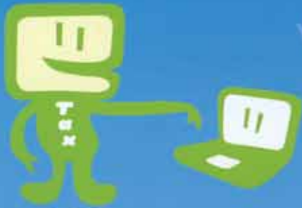
イー tax 君