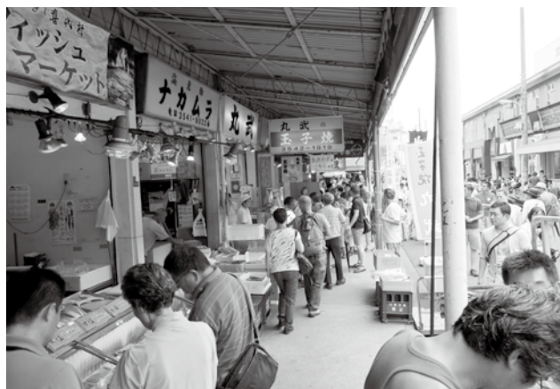
▲築地場外市場で買い物