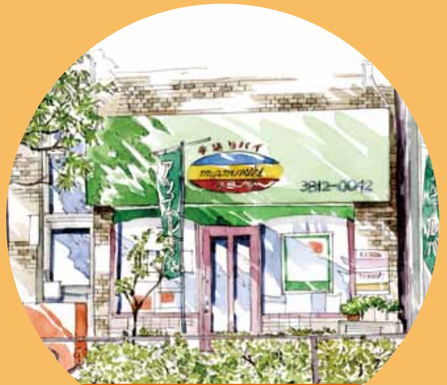
マミーズ・アン・スリール本店「パイ」

アップルパイの専門店。ホールのパイが並ぶ店内は温もりが溢れている。キッシュやパウンドケーキも素朴な味わい。