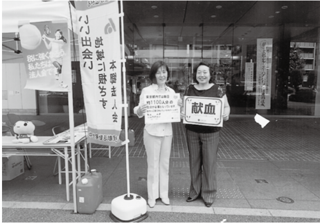
▲山中女性部会長(左)と富田副部会長(右)がPR