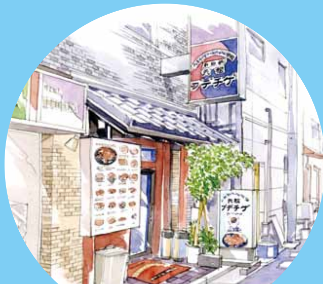
元祖ブデチゲ『韓国鍋・韓国家庭料理』

韓流芸能人などに注目の韓国チゲ「ブデチゲ」の専門店。本場の食材を使用した韓国家庭料理も楽しめる。