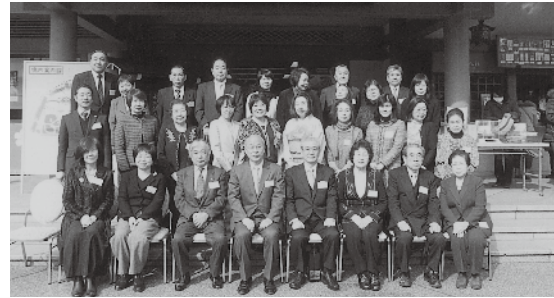
▲ 本殿前での記念撮影