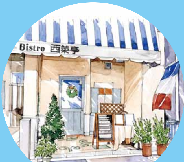
南欧料理ビストロ 西菜亭『フランス料理』

パリ郊外のプチ・レストランの雰囲気。伝統的なフランス料理を気軽に味わえるビストロとして地元で愛されている。