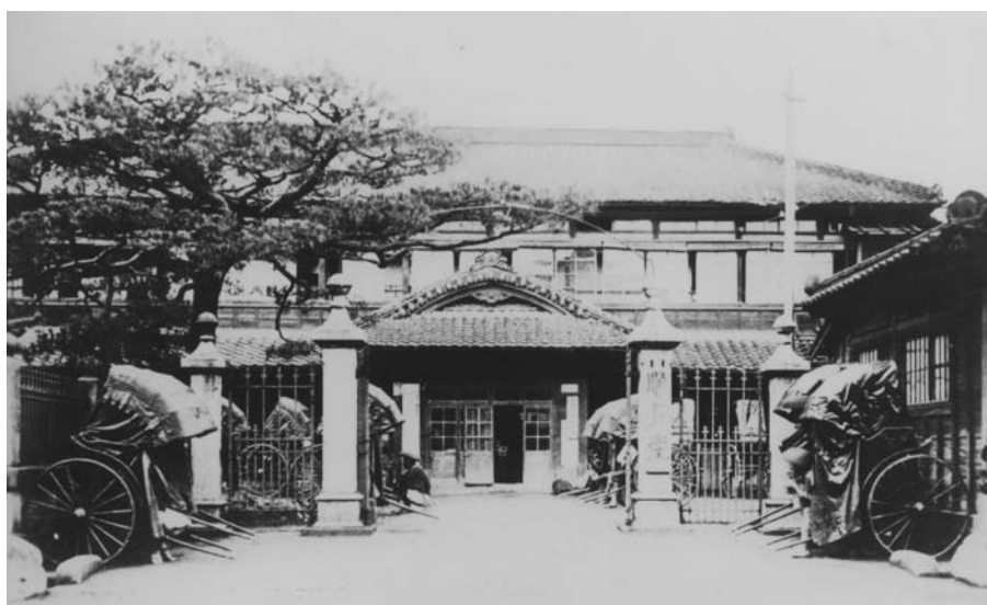
④本郷湯島の順天堂