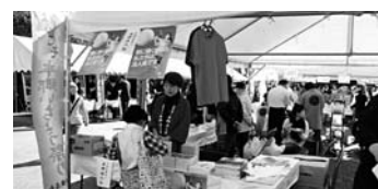
社会貢献活動を実施