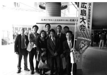
会場前で記念撮影をする役員方

全国11会による「租税教育活動」プレゼンテーションでは、各単位会大変趣向を凝らした活動報告がありました。静岡法人会は、「サッカー」が盛んな地域でもあり有名選手を呼んだイベントの開催。倉吉(鳥取)法人会では、地元の短期大学生に対しハイレベルな税金クイズの開催。南会津法人会では、会津藩の“おきて”にちなんだ教室など。全法連青連協の役員と全国の各部会長による公正な投票の結果、松戸法人会の「落語税金教室」が最優秀賞に選ばれました。落語と税金をコラボさせた授業が紹介され、子供達が非常に楽しく税金を覚えていく様子が印象的でした。当青