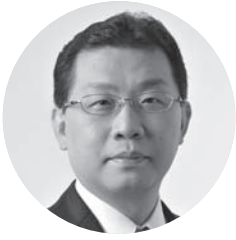
文京区長 成澤 廣修