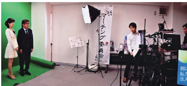
スタジオでの撮影の様子