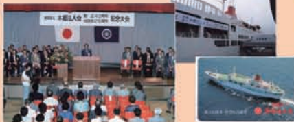
創立 40 周年・社団化 25 周年記念大会を新さくら丸で式典のほか余興として大道芸人や一龍斎水刺居による程談院が公演された。「雄海号」を出演～横浜大磯線 航海中で開催 (平成 3 年 8 月 8 日 新さくら丸船上)