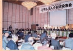
モデル法人会は毎朝朝日本と西日本で 1 単位会ずつ指定され、それぞれ 1 年間の目標を立てて活動し、その成果を発表するというものであった。全法連より指定された当会の決めたテーマは「法人会の充実と向上への考察」と定め、昭和 62 年度を充てることとし、第 1 考察委員会では次の 5 つのテーマについて研究した。第 2 考察委員会では次の 7 つのテーマについて研究した。(昭和 63 年 3 月 29 日 虎ノ門パストラル)