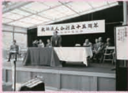
創立 15 周年祝賀会 (昭和 39 年 4 月 25 日 榎山荘)