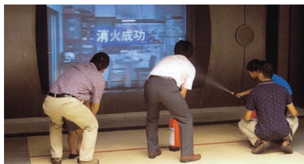
消火体験をする参加者