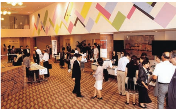
496名の参加者が会場内へ