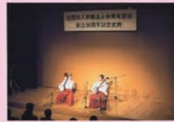
青年部会創立35周年記念コンサート/新進気鋭の演劇三味線舞臺・新田正弘氏と小山豊氏が記念式典を盛り上げる (平成22年11月15日 文化シヤッターB Xホール)

法は約1m×約1.6mで太陽電池の翼を広げた状態で6m四方、イオンエンジン4基、カメラ、レーザー高度計、X線計測装置、赤外線観測装置など科学観測機器を持ちます。名前の由来は急降下してサンプルを回収しすぐに飛び立つところから文字通り鳥の“はやぶさ”からきております。