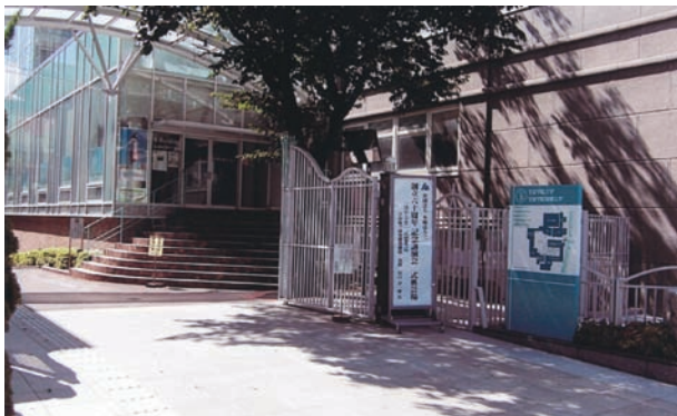
会場となった文京学院大学