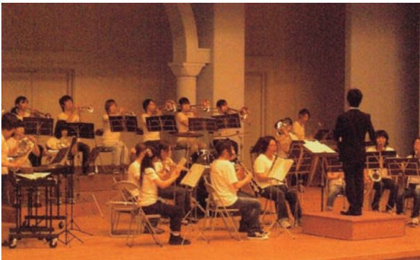
吹奏楽部の皆さん