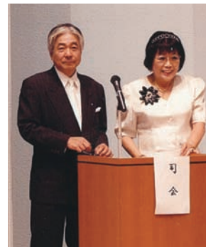
来賓の紹介をする松沼女性部会長