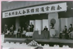
第 4 回通常総会 (昭和 45 年 5 月 16 日)