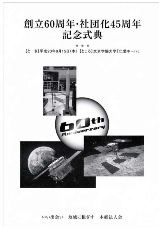
当日のプログラム