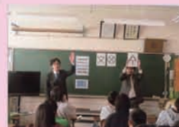
確定申告の広報活動を実施。青年部会と女性部会がe-Taxの推進を兼ねた確定申告の広報活動を毎年初日に実施。夏の幹事も参加 (平成22年2月15日 湯島天満宮境内)