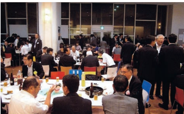
学生食堂での祝賀会