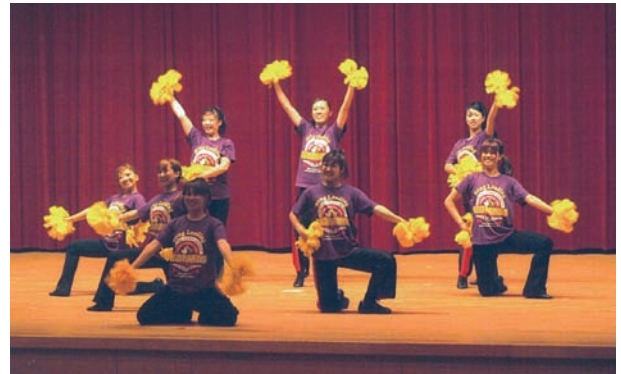
ソングリーディング・ダンスチーム「LEOPARDS」の皆さん