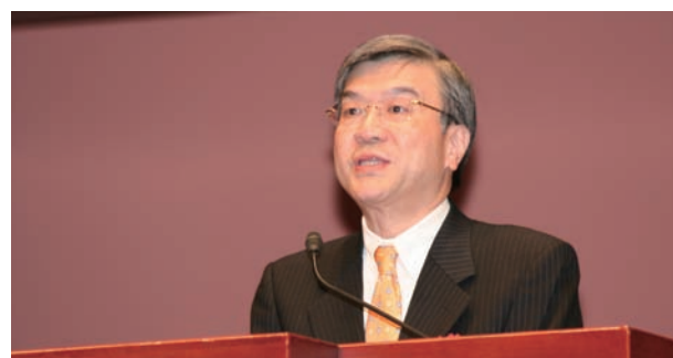
祝辞を述べる川北国税庁長官