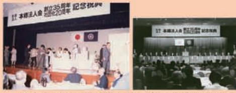
創立 35 周年・社団化 20 周年記念祝賀会開催 / 豪華賞品などが当たる抽引を楽しむ (平成 6 年 10 月 17 日 帝國ホテル)