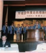
平成 9 年年度総会開催推進大会 / 当時は 10 周年記念式典で出陣式を行うのが恒例とな