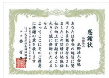
記念事業に対して、文京区社会福祉協議会より感謝状が贈呈された

写真提供：JAXA 撮影：村山 哲／五十嵐正樹 協力：文京学院大学／中央宣伝企画(株)