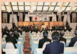
創立55周年・社団化40周年記念講演会を開催 テーマ：新政権における経済政策 講師：元・財務大臣・(学)東洋大学総長 堀川正十郎氏 (平成18年10月30日 東京ガーデンバレス)