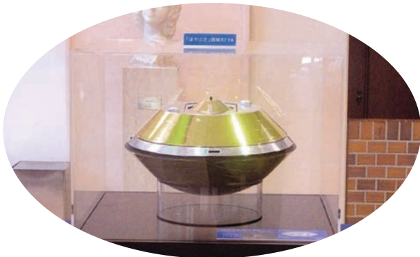
回収カプセルの実物大模型