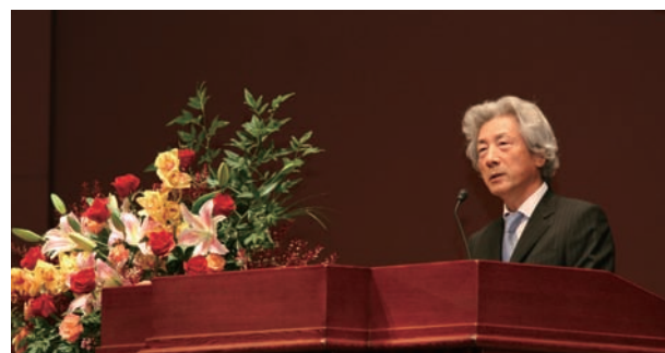
講演をする元内閣総理大臣小泉純一郎氏