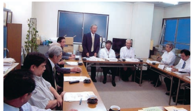
あいさつをする五十嵐第4ブロック長